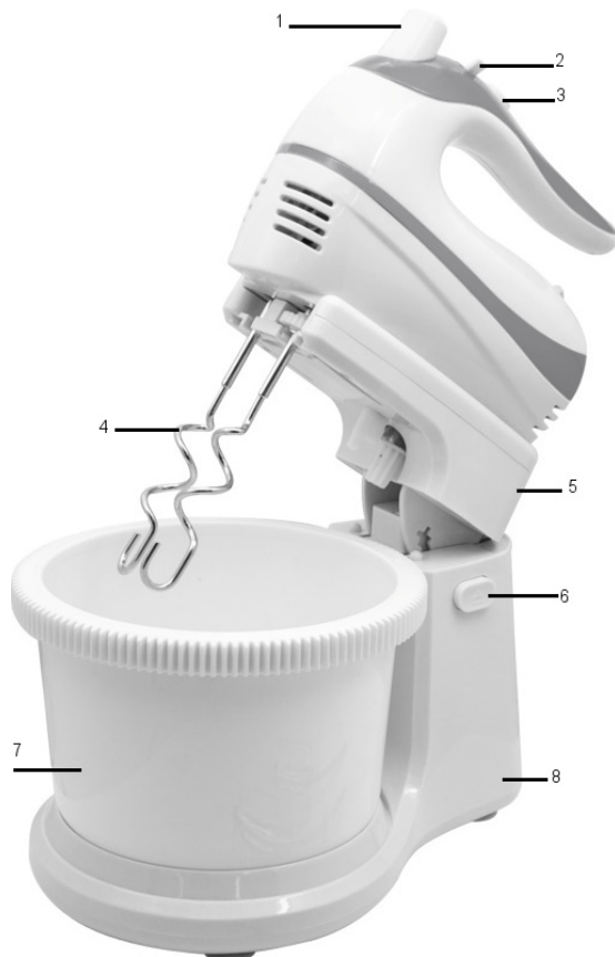
Haki do ugniatania